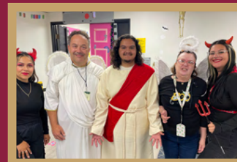
Lo más destacado de Halloween Ver más en la página 3.