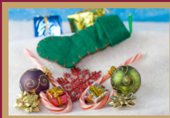
Medias y adornos Ver más en la página 2.