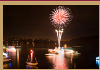
Desfile de luces Ver más en la página 1.

Haga clic aquí o escanee el código QR para escuchar el audio del boletín en Español